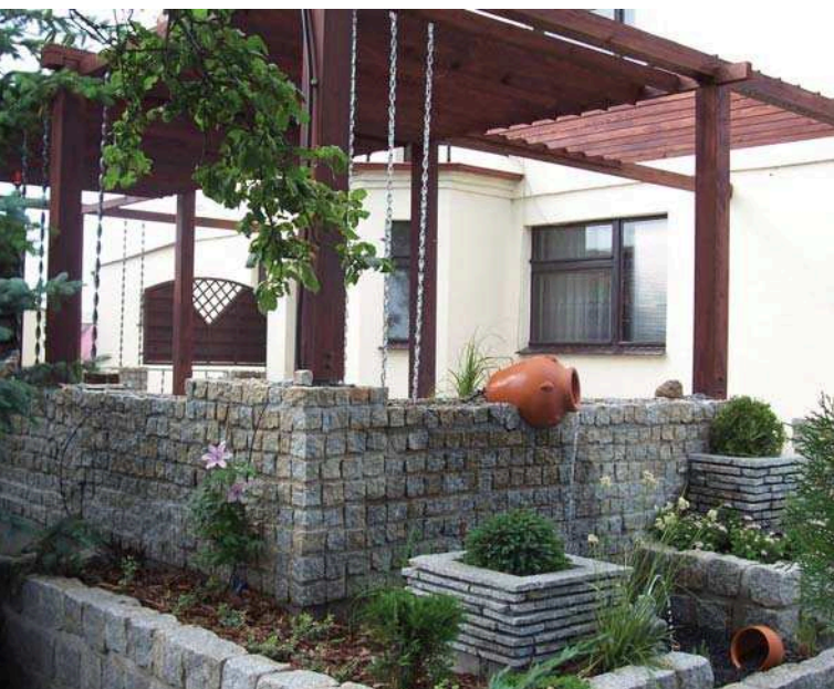
Widok od strony ławki w ogrodzie

Duża powierzchnia tarasu oraz elewacja budynku w letnie upalne dni pochłaniały promieniowanie słoneczne, podnosząc temperaturę otoczenia, przez co trudno było użytkować to miejsce. W dodatku taras znajduje się 70 cm powyżej poziomu obsadzonego terenu, a więc mimo żywopłotu doskonale było widać osoby wypoczywające. Przede wszystkim należało poprawić mikroklimat na tarasie i osłonić go przed wzrokiem sąsiadów. Właściciele chcieli też wybudować bezpośrednio zejście do ogrodu i dostosować taras do organizowania spotkań z przyjaciółmi.