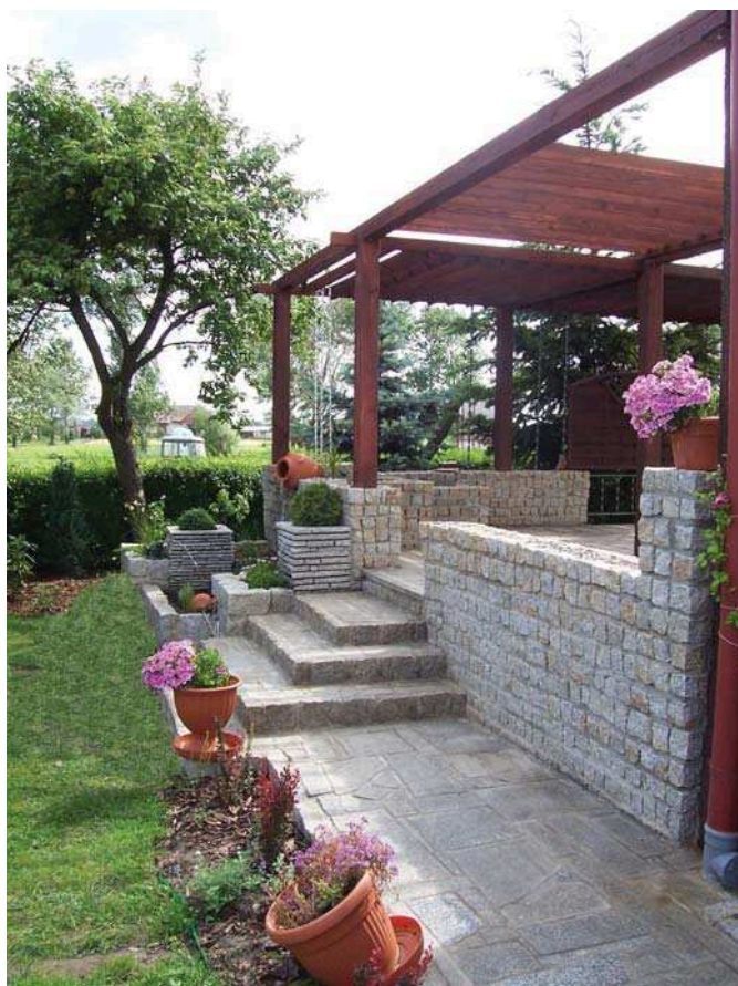
Zejście do ogrodu